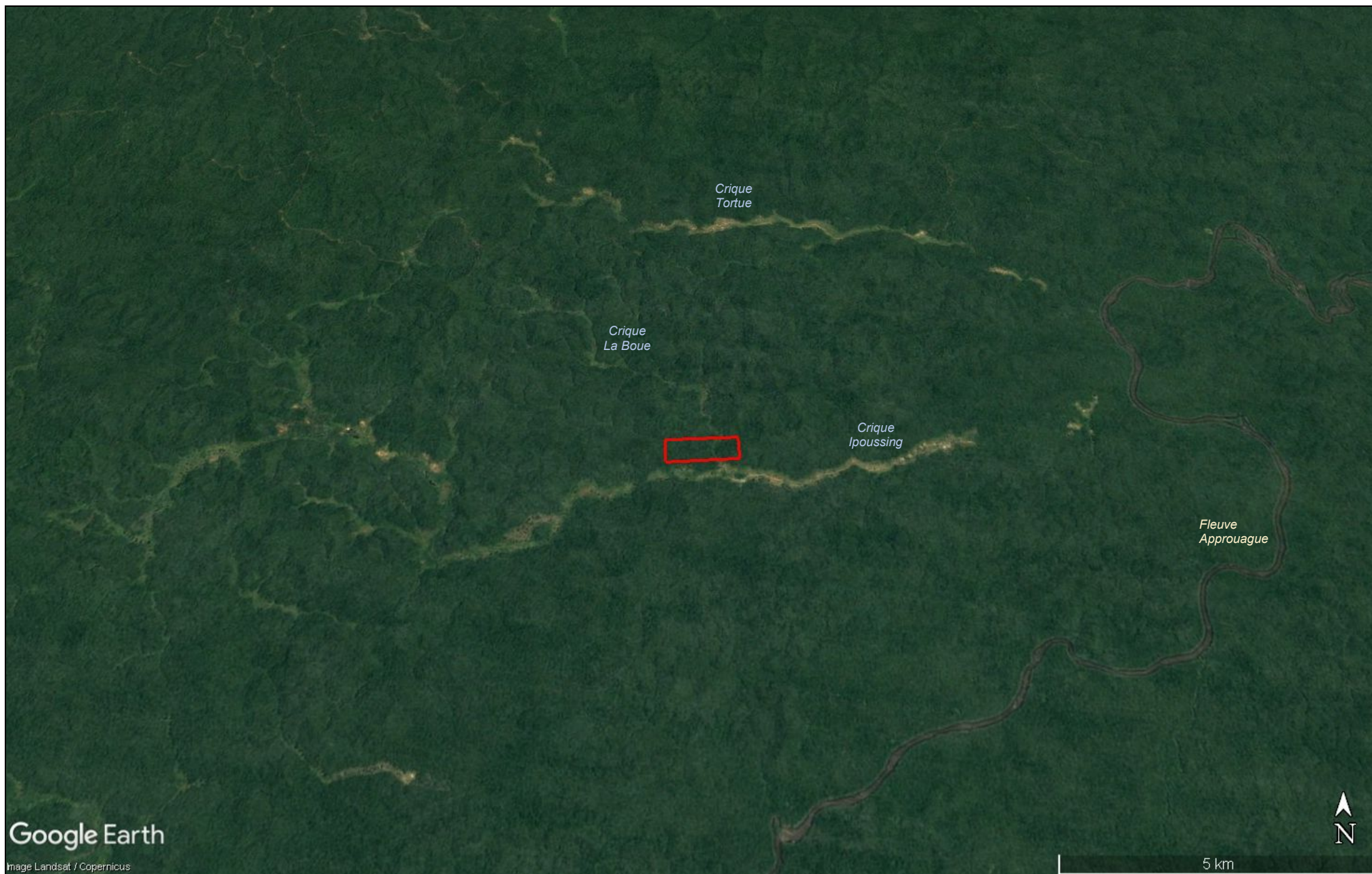
Vue satellitaire éloignée de la zone de l'AEX « crique Calou » de l'EURL SAINT-GEORGES d'après Google Earth (2023)